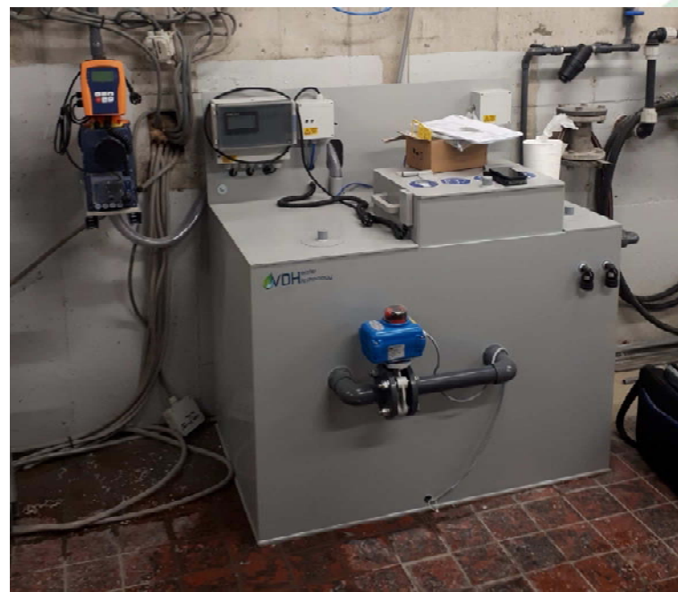
Back up calciumhypochloriet installatie