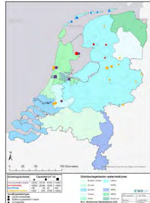
Afbeelding 3. Geavanceerde zuiveringstechnieken toegepast door Nederlandse drinkwaterbedrijven ten behoeve van de drinkwaterproductie (2020)

6 van de 10 Nederlandse drinkwaterbedrijven passen op 24 verschillende plaatsen één of meerdere geavanceerde zuiveringstechnieken toe